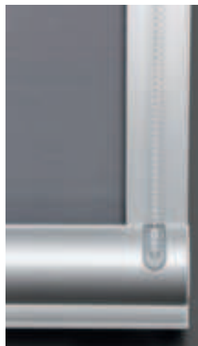
Bedienung mit transparenter Kette links oder rechts und Bediengriff aus Kunststoff. Auf Wunsch mit dem puristisch anmutenden Bediengriff aus Aluminium. Arretierung an jeder gewünschten Stelle ist immer gegeben.