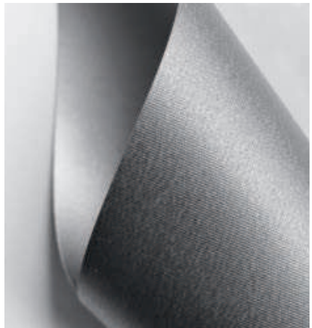
Abdunklungsstoff GEO mit beidseitiger infrarot-reflektierender Beschichtung.