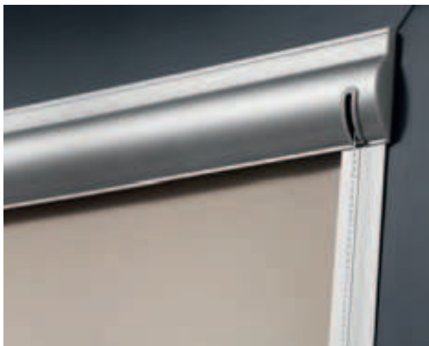
Formschöne Abdeckung und Seitenführungsschienen aus Aluminium, erhältlich in den Farben weiß und silber, auf Wunsch in jeder RAL Farbe möglich.