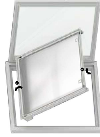
Kinderleichtes Einsetzen von innen So easy to install, from inside the room