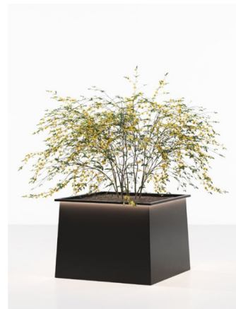
Cubo Led, different types of configuration Structure: N1 black painted

En función de las necesidades del cliente y de la disposición de su espacio exterior, pueden elegirse distintos tipos de configuración. Por lo general, las tiras led se instalan en las paredes frontales de la jardinera, pero también hay disponibles paredes esquinas especiales para montar ledes en los lados cortos. Como elemento opcional, para aquellos a los que les guste el juego de luces que crea la interacción entre los ledes y las formas de las plantas, flores y arbustos de las jardineras, se pueden instalar tiras led directamente dentro de la jardinera. Otra opción es instalar luces led bajo la jardinera, creando una auténtica cinta de luz que anima y define el espacio arquitectónico.